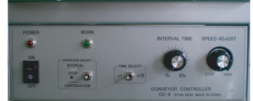
控制箱 CC-4 (連續、間歇、可變速運轉) コントロールBOX CC-4 (連続、間欠及び可変速運轉) control box CC-4 (Consecutive、Intermittent and Variable Speed Operation)